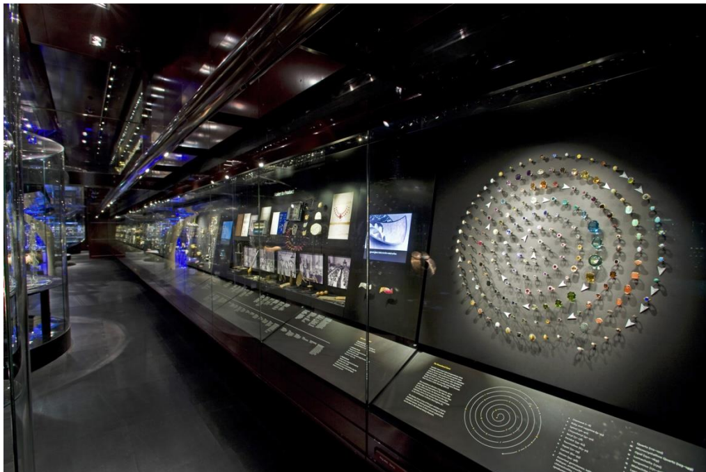
شکل ۳. نحوه نمایش و چیدمان صحیح نمونه‌ها. نحوه نمایش و چیدمان صحیح نمونه‌ها و نورپردازی استاندارد برای بروز بیشترین جلوه بصری در کنار توضیحات مندرج برای هر نمونه، بخش جواهرات موزه A&V.